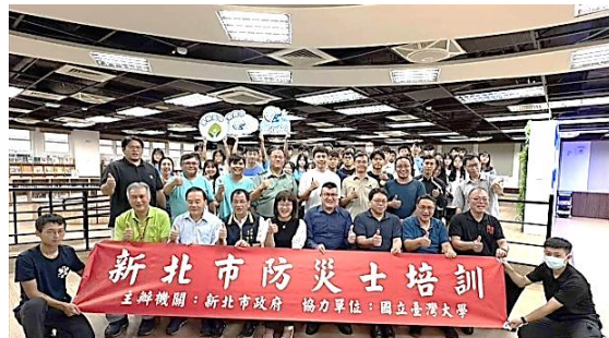
圖示：強韌新北，萬『士』齊備」成果發表會