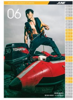
105 年 6 月份消防月曆(男性消防人員)