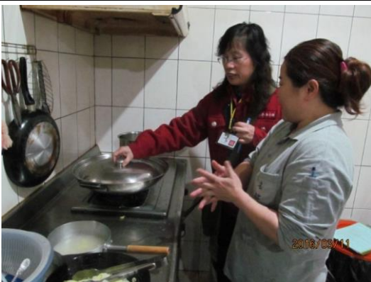
婦宣隊員協助檢視民眾家中用火安全