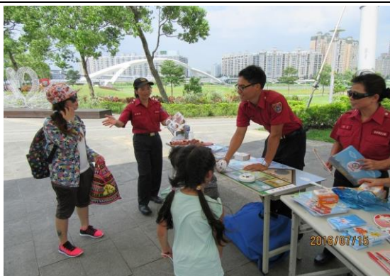
於社區辦理防火宣導活動