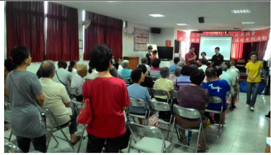
新店區屈尺里社區防救災、救護訓練