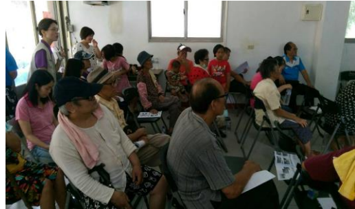
烏來區信賢里社區任務分工與防災計畫 研擬