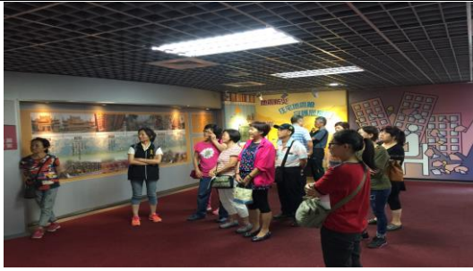
三重區福民里參訪臺北市防災教育館