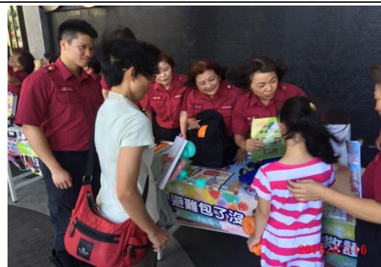
於團體辦理防火宣導活動