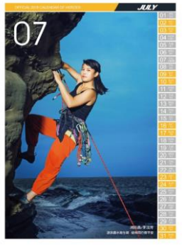
105 年 7 月份消防月曆(女性消防人員)