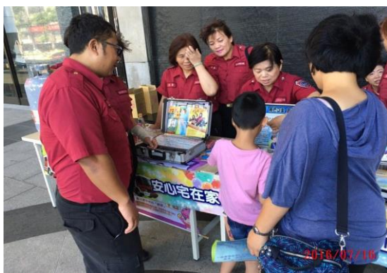
於校園辦理防火宣導活動