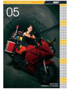
105 年 5 月份消防月曆(女性消防人員)