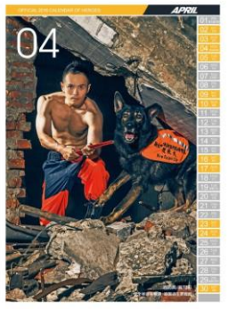
105 年 4 月份消防月曆(男性消防人員)