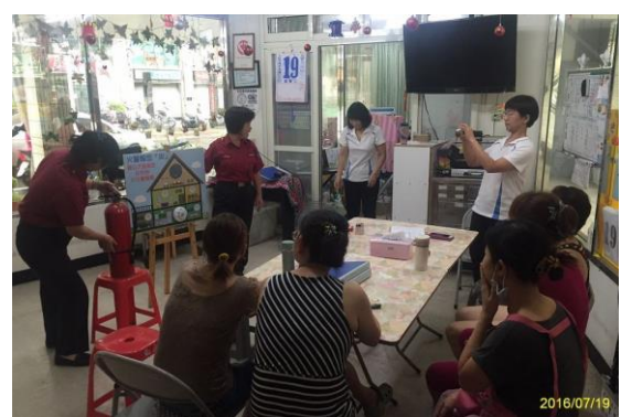
於機關辦理防火宣導活動