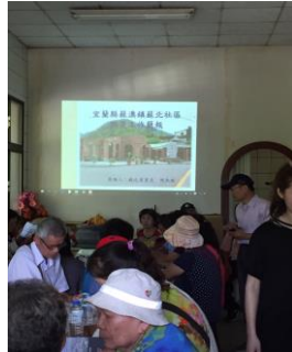
三峽區五寮里參訪宜蘭蘇澳鎮蘇北里